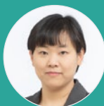
大原 美保 東京大学大学院情報学環 教授 東京大学生産技術研究所 教授