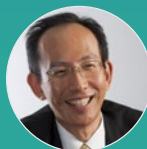
喜連川 優 情報・システム研究機構長 東京大学 特別教授